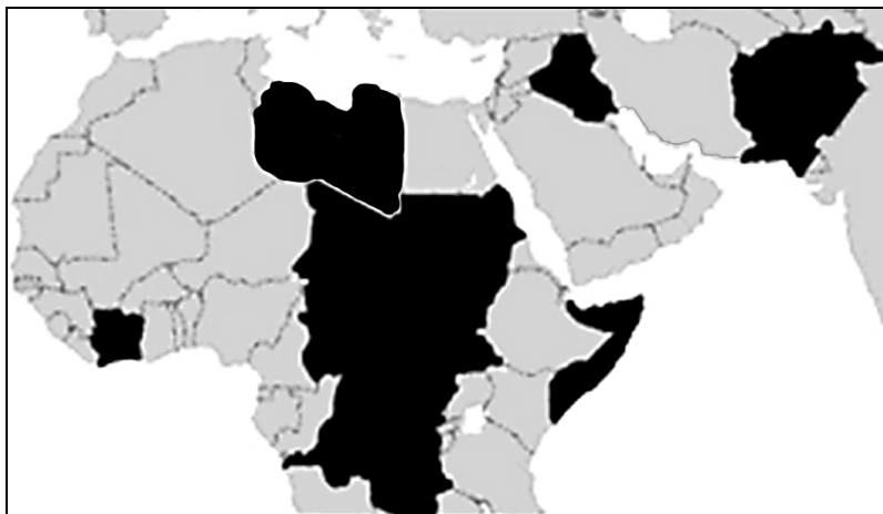
Рис. 20.2. Карта недееспособных государств (failed states)