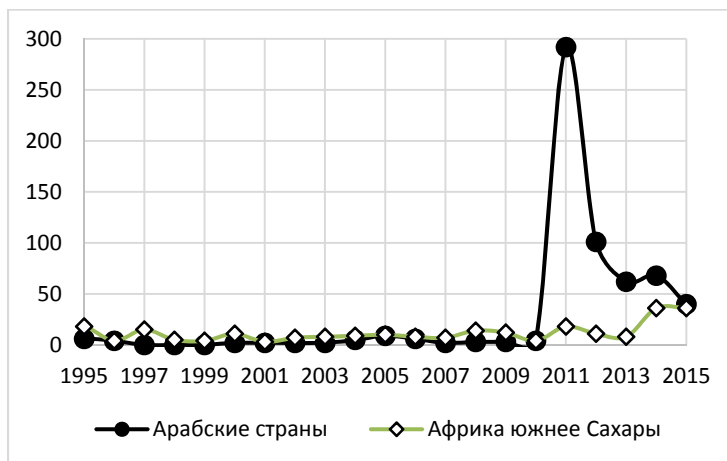
Рис. 2. Динамика общего числа крупных антиправительственных демонстраций, зафиксированных базой данных CNTS в странах Африки южнее Сахары и арабском мире в 1995–2015 гг.

Рост общего числа антиправительственных демонстраций в Африке южнее Сахары в 2011–2015 гг. был не особо сильным по сравнению с большинством других мир-системных макрорезон, но по меркам самой этой макрорезоны был очень заметным, и локальный исторический рекорд по этому показателю Африка в 2014 г. все-таки побила (см. Рис. 2).