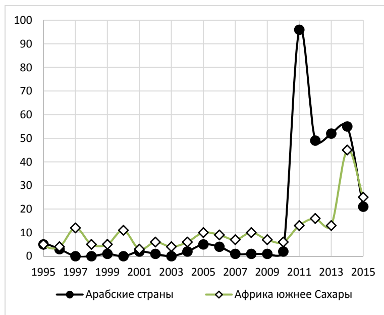
Рис. 3. Динамика общего числа крупных массовых беспорядков, зафиксированных базой данных CNTS в странах Африки южнее Сахары и арабском мире в 1995–2015 гг.

Очень похожая картина в 2011–2015 гг. наблюдалась в Африке южнее Сахары и применительно к массовым беспорядкам; впрочем, рост их числа здесь в эти годы был заметно более выразительным (см. Рис. 3).