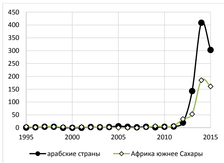
Рис. 5. Динамика общего числа крупных террористических актов / «партизанских действий», зафиксированных базой данных CNTS в странах Африки южнее Сахары и арабском мире в 1995–2015 гг.

сти развернувшиеся по трагическому сценарию события в Ливии и дальнейший фактический распад этого североафриканского государства, вызванный военно-политическим конфликтом. Многие военные склады после падения режима М. Каддафи были разграблены, что открыло легкий доступ к ливийскому оружию членам вооруженных террористических, криминальных организаций.