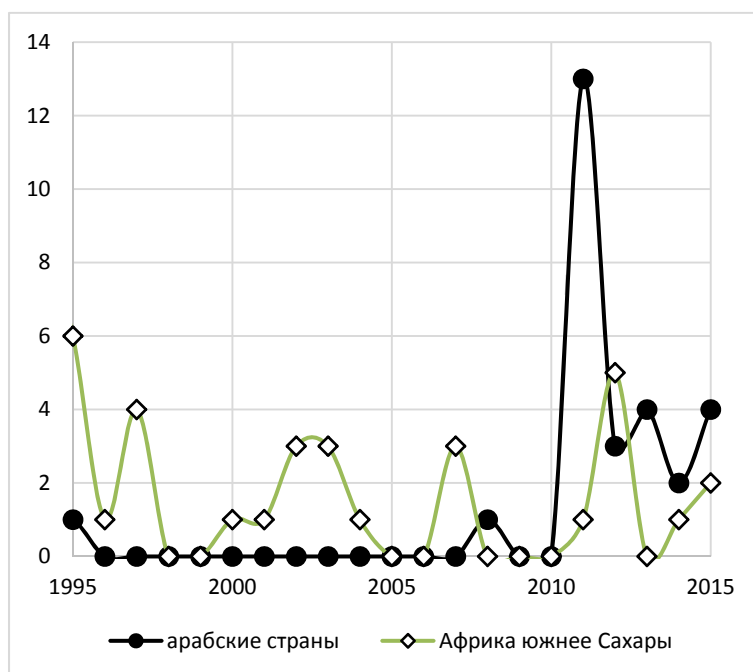
Рис. 4. Динамика общего числа политических забастовок, зафиксированных базой данных CNTS в странах Африки южнее Сахары и арабском мире в 1995–2015 гг.

шлись также на сектор здравоохранения: врачи и прочий медицинский персонал требовали повышения заработной платы и улучшения условий труда. Тысячи бастующих работников были уволены (The Guardian 2012; BBC News 2013).