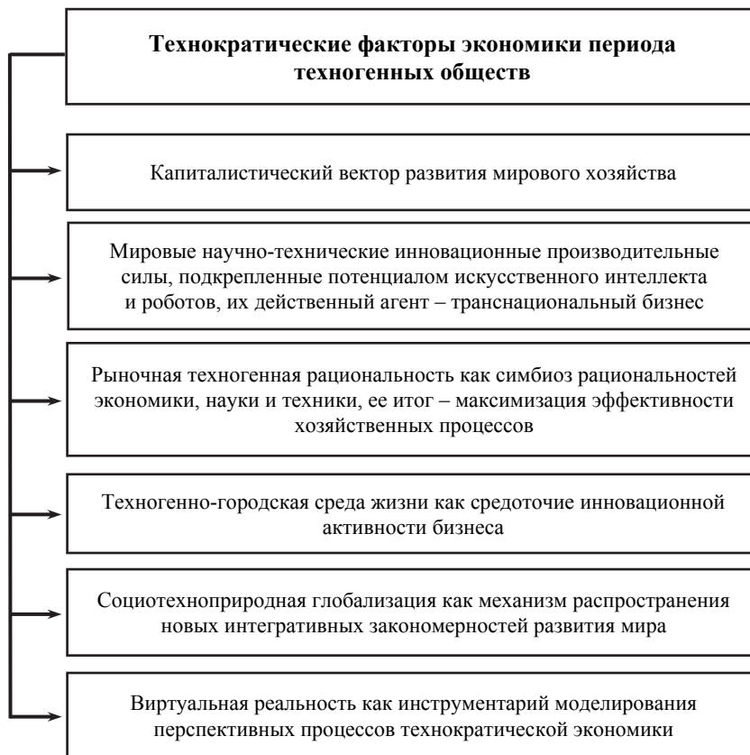
Рис. 1. Технократические факторы экономики периода техногенных обществ

ствия рациональностей – максимизация эффективности хозяйственных процессов [Дергачева 2016].